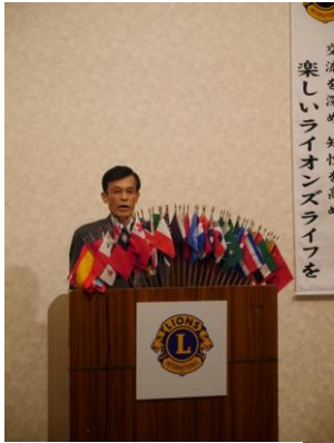
L北村 ライオンズの誓い